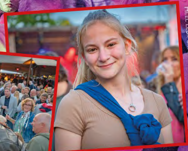
LIDE (17): "IK BEN HIER MET MIJN MOEDER. WE HOUDEN ALLEBEI WEL VAN MUZIEK. HEEL LEUK OM DIT SAMEN TE BELEVEN."