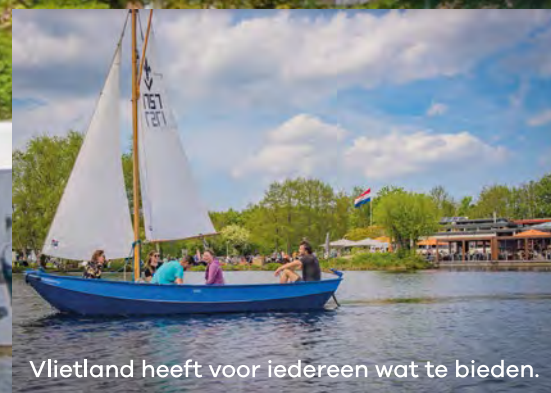
Vlietland heeft voor iedereen wat te bieden.