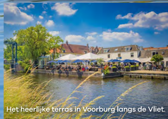
Het heerlijke terras in Voorburg langs de Vliet.

Tekst: Mark Baars