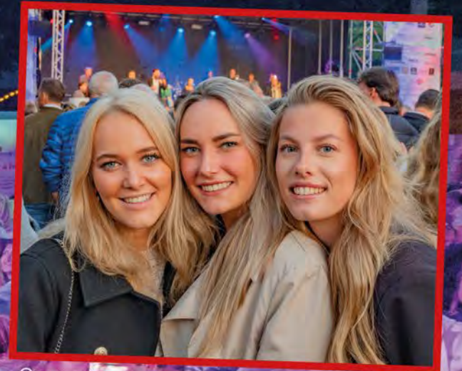
CHARLOTTE MET HAAR VRIENDINNEN: "WE KOMEN VOOR OG3NE! DIT SOORT FESTIVALS MOGEN WEL VAKER HIER PLAATSVINDEN!"