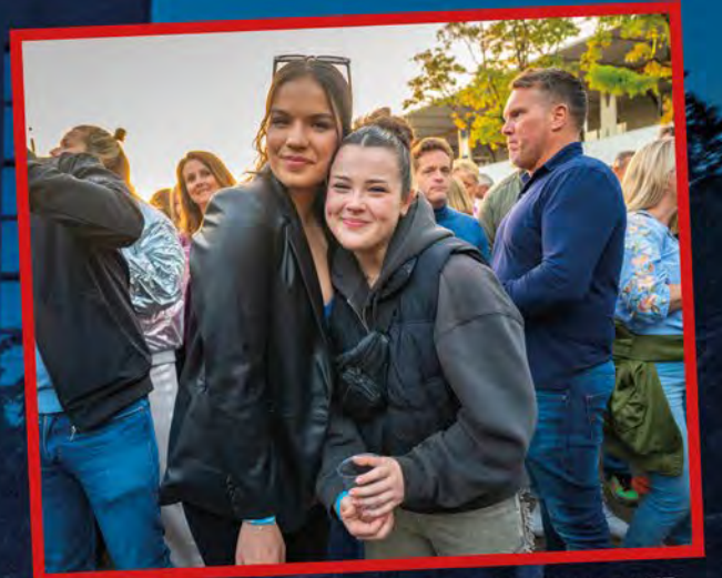
ROSA EN SELENA: "HET IS HEEL GEZELLIG OM HIER MET VRIENDEN DICHT BIJ HUIS TE ZIJN."