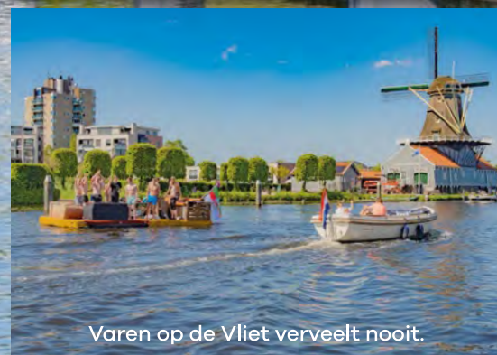
Varen op de Vliet verveelt nooit.