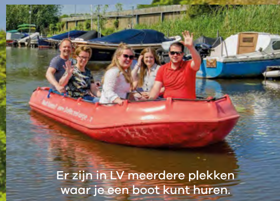
Er zijn in LV meerdere plekken waar je een boot kunt huren.

Kijk voor meer informatie op www.lvverrast.nl