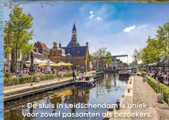
De sluis in Leidschendam is uniek voor zowel passanten als bezoekers.